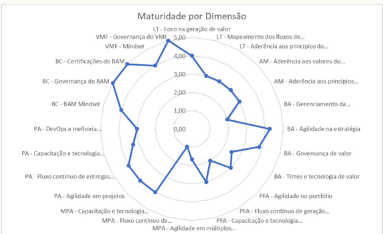
Figura 2: nível de maturidade por dimensão

Value Management Maturity Model - VM Ready by Norberto Almeida and Mario Sampaio is licensed under CC BY-ND 4.0